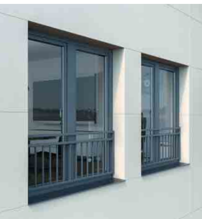
Die vertikale Aluminium-Stangenabsturzsicherung verschmilzt dank der Beschichtungsoption Ton-in-Ton zu einer optischen Einheit