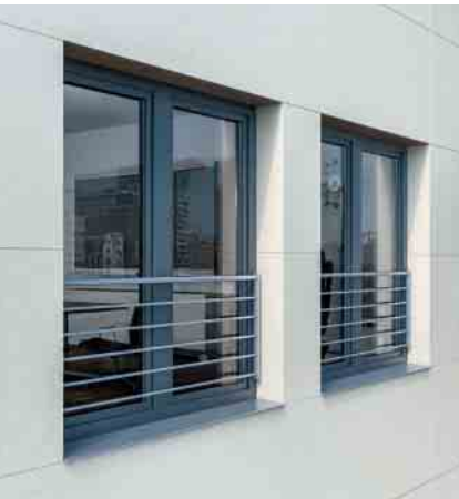
Individuelle Akzente setzen mit der horizontalen Edelstahl-Stangenvariante der Schüco Absturzsicherungen