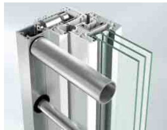
Befestigung mit Profildübel

Stangenvariante Horizontal Durchmesser von 12 bis 35 mm