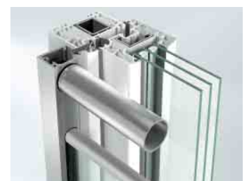
Befestigung mit Falzleiste