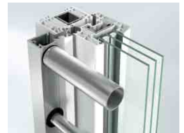
Befestigung mit Falzleiste