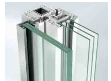
Befestigung mit Falzleiste

Stangenvariante Horizontal Durchmesser von 12 bis 35 mm