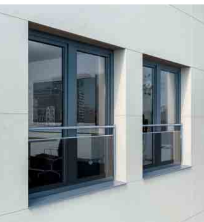
Als kombinierte Variante mit Stange und Glas bilden Absturzsicherungen ein Highlight in der Fassadenansicht

Bauherren wünschen sich heute hellere, lichtdurchflutete Räume. Entsprechend geht der Trend zu raumhohen, bodentiefen Fensterelementen, deren Absturzsicherheit durch Normen und Verordnungen geregelt ist. Dies ging bisher oft zu Lasten der Fassadenoptik. Die modernen Absturzsicherungen für Schüco Kunststoff-Systeme werden direkt am Fensterprofil montiert und fügen sich so harmonisch in das Fassadenbild ein. Überdies sind sie als komplette Einheiten mit Schüco Kunststoff-Fenstern geprüft und bieten maximale Sicherheit sowie entscheidende Effizienzvorteile bei der Verarbeitung und Montage.