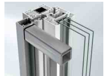
Befestigung mit Falzleiste