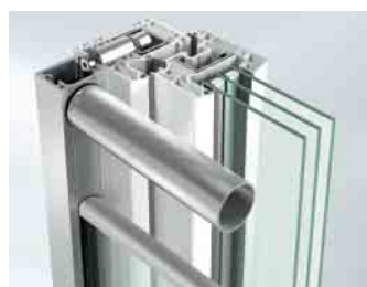
Befestigung mit Profildübel