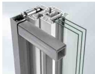
Befestigung mit Profildübel